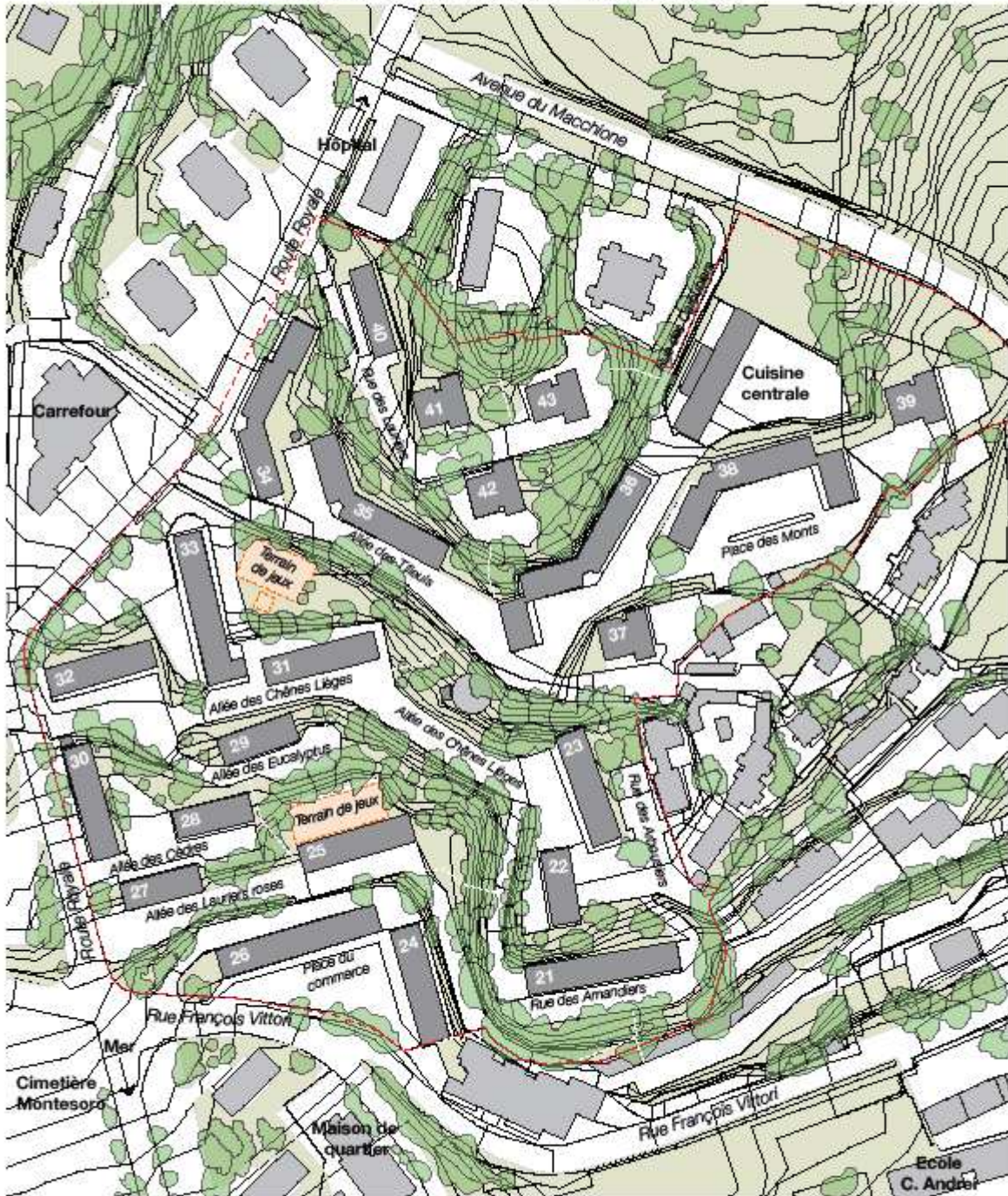
Plan des cités des lacs, des arbres et des monts